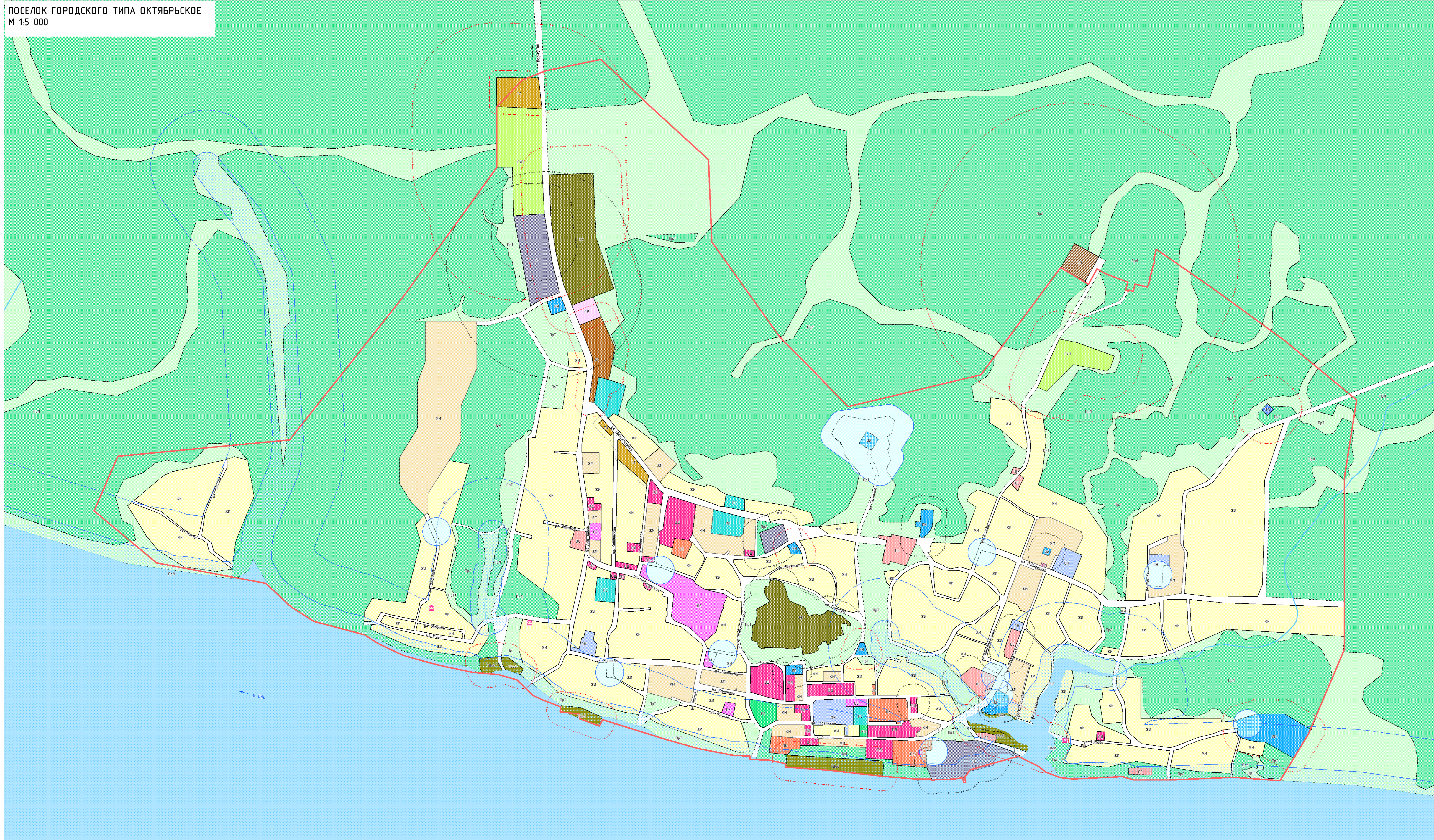
ПОСЕЛОК ГОРОДСКОГО ТИПА ОКТЯБРЬСКОЕ М 1:5 000